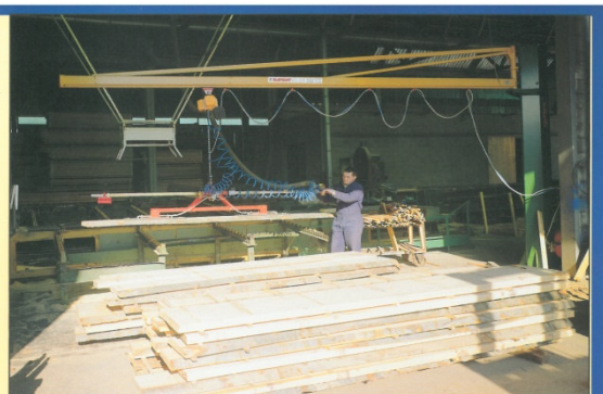
GRU A COLONNA CON VENTOSA TIPO TV2, dotata di manico telescopico longitudinale • Column crane with TV2 vacuum grab fitted with longitudinal telescopic handle • Grue à colonne avec ventouse type TV2, dotée de poignée télescopique longitudinale.