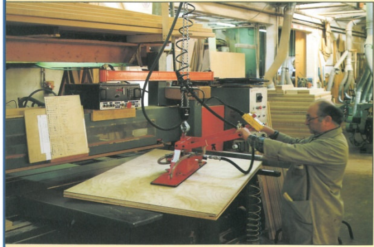
VENTOSA PNT1F adatta per pannelli truciolari di piccole dimensioni • PNT1F vacuum grab suitable for small chipboard panels • Ventouse PNT1F indiquée pour panneaux de bois aggloméré de petite taille.