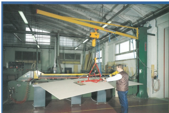
GRU A COLONNA CON VENTOSA PNT2F adatta per pannelli truciolari • column crane with PNT2F vacuum grab suitable for chipboard panels • Grue à colonne avec ventouse PNT2F indiquée pour panneaux de bois agglomérés.