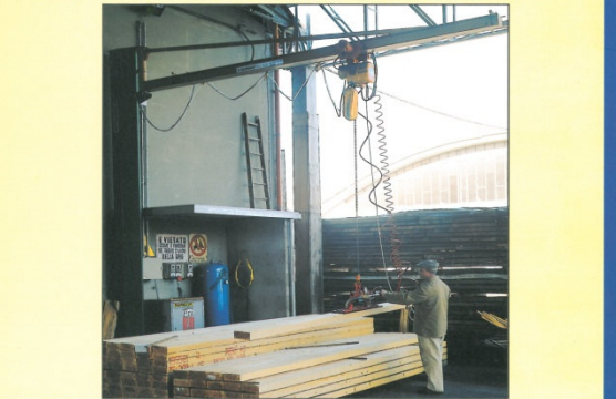
GRU A COLONNA CON VENTOSA TIPO TV1, dotata di manico centrale • Column crane with TV1 vacuum grab fitted with central handle • Grue à colonne avec ventouse type TV1, dotée de poignée centrale.