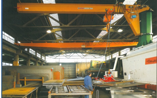
GRU A COLONNA CON VENTOSA TIPO VLA6F Kg. 1000 a 6 piastre rotonde • Column crane with vacuum grab model VLA6F 1000 Kg. with 6 round plates • Grue à colonne avec ventouse type VLA6F 1000 Kg. à 6 plaques rondes • Kran auf Rohrkonstruktion mit Saugnapf des Typs VLA6F aus 6 runden Platten für 1000 Kg. • Grúa de columna con ventosa tipo VLA6F 1000 Kg con 6 planchas redondas.