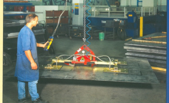
VENTOSA A 4 PIASTRE RETTANGOLARI portata Kg. 1000 • Vacuum grab with 4 rectangular plates, capacity 1000 Kg. Ventosa à 4 plaques rectangulaires, portée 1000 Kg. • Saugnapf aus 4 rechteckigen Platten für 1000 Kg. Gewicht • Grúa de 4 planchas rectangulares con capacidad de carga de 1000 kg