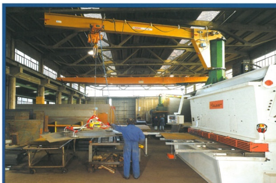
GRU A COLONNA CON VENTOSA TIPO VLA4F Kg. 500 a 4 piastre rotonde • Column crane with vacuum grab model VLA4F 500 Kg. with 4 round plates • Grue à colonne avec ventouse type VLA4F 500 Kg. à 4 plaques rondes • Kran auf Rohrkonstruktion mit Saugnapf des Typs VLA4F aus 4 runden Platten für 500 Kg. • Grúa de columna con ventosa tipo VLA4F 500 Kg con 4 planchas redondas.